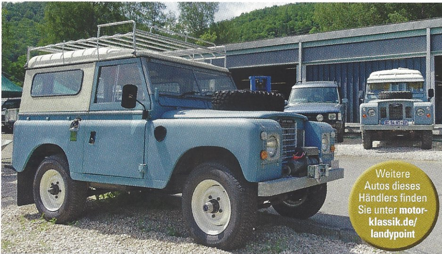
Land Rover Serie III, EZ 1983, Vierzylinder, 2238 cm 3 , 69 PS, 117 000 km, 26 000 Euro